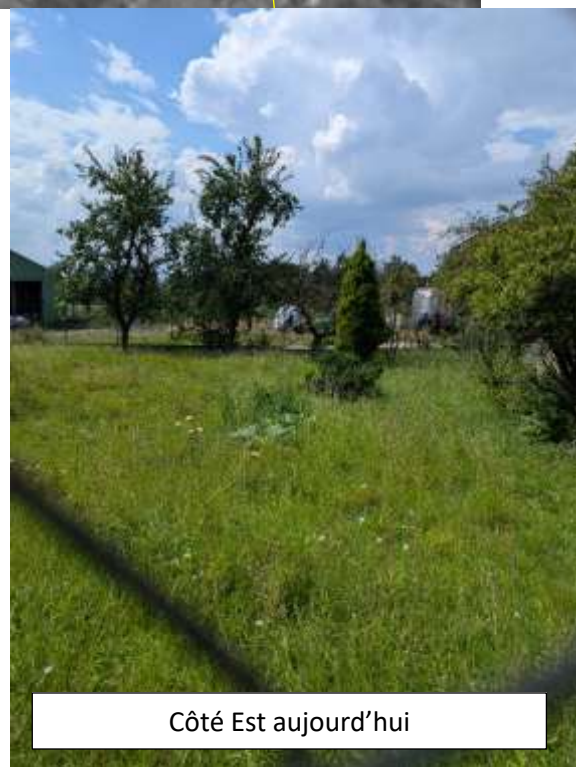
Côté Est aujourd'hui