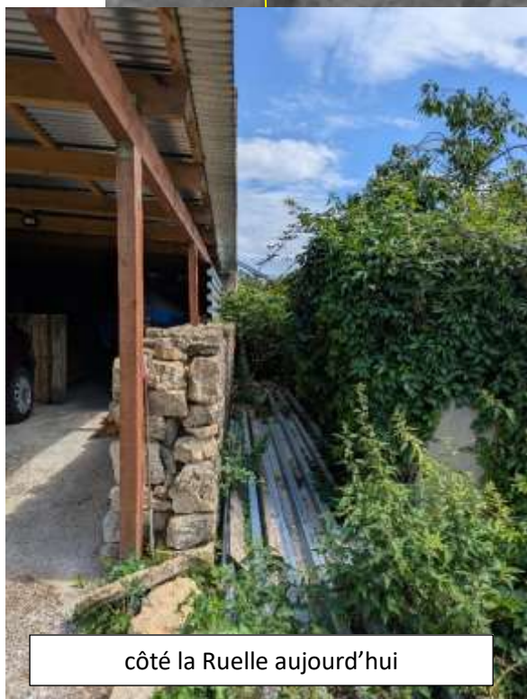
côté la Ruelle aujourd'hui