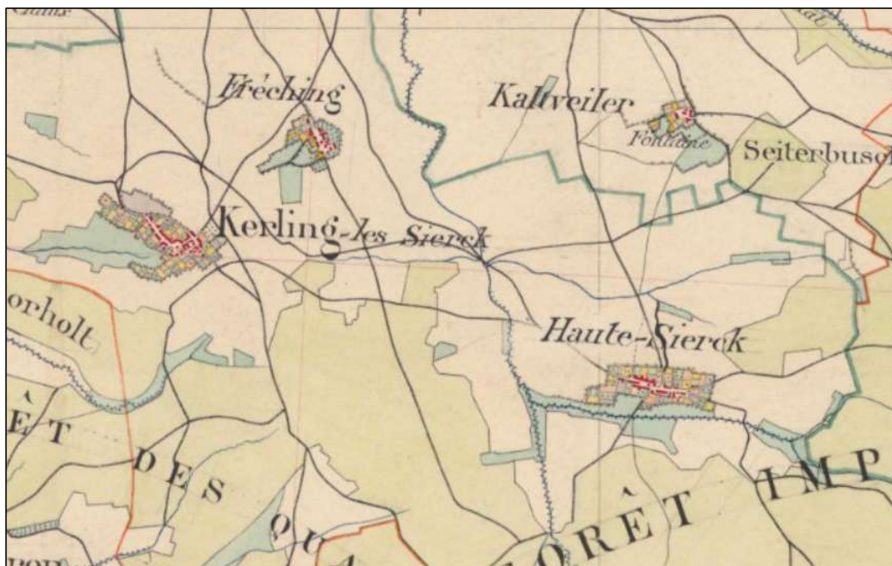
Carte d'état-major du 19 e siècle

Enquête publique du dimanche 21 septembre au lundi 6 octobre 2025