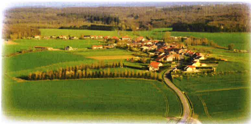
Panorama de Haute-Sierck – ouvrage « regards sur la Communauté de Communes Trois Frontières » 2012 – autorisation CCB3F