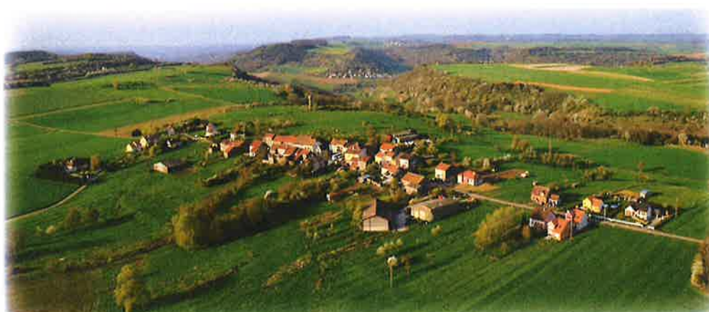
Panorama de Fréching – ouvrage « regards sur la Communauté de Communes Trois Frontières » 2012